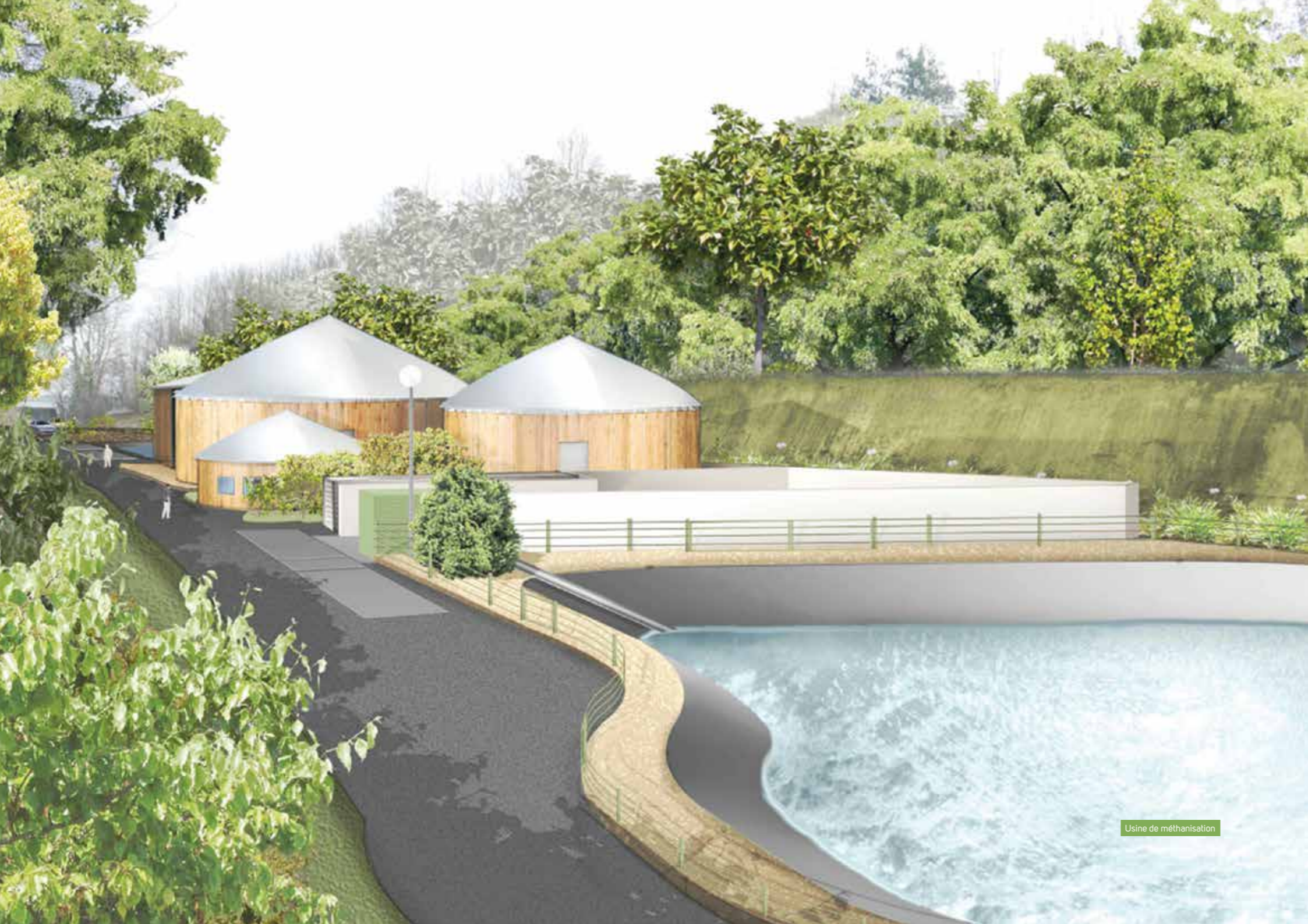
Usine de méthanisation