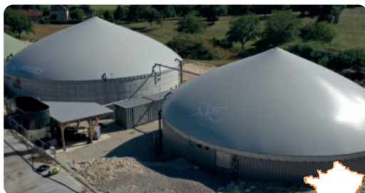
FOUCHÉ - NERCIENS